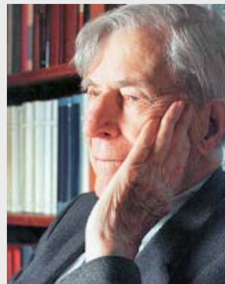
ΤΖΟΝ ΚΕΝΕΘ ΓΚΑΛΜΠΡΕΪΘ (1908-2006)

Από τους κορυφαίους Αμερικανούς οικονομολόγους του αιώνα που πέρασε. Γεννημένος στο Οντάριο του Καναδά σπούδασε εκεί Αγροτική Οικονομία και κατόπιν έκανε μεταπτυχιακά στην Καλιφόρνια και στο Κέμπριτζ. Από το 1949 έως το 1975 διατήρησε έδρα στο διάσημο Πανεπιστήμιο Χάρβαρντ. Τα μαθήματα, τα σεμινάρια, οι διαλέξεις και τα βιβλία του ήταν πάντα «γροθιές» στο οικονομικό μοντέλο των Ηνωμένων Πολιτειών. Η ανατομία που έκανε στους κοινωνικούς λόγους που προκάλεσαν το «κράχ» του 1929 «σιγματίσαν» τον Γκαλμπρέιθ ως οπαδό του Κέινς αλλά και ως «αριστερό». Πολιτικά είχε ταχθεί στη φιλελεύθερη πτέρυγα του Δημοκρατικού Κόμματος και ήταν φίλος και συνεργάτης του Τζον Κένεντι. Διετέλεσε μάλιστα πρεσβευτής των ΗΠΑ στην Ινδία από το 1961 έως το 1963. Οι απόψεις του, όμως, για κοινωνικό κράτος και έλεγχο της καπιταλιστικής αγοράς χαρακτηρίστηκαν υπέρ το δέον ανατρεπτικές και αριστερές και από τους Δημοκρατικούς, με συνέπεια ο Γκαλμπρέιθ να βρεθεί πολιτικά άστεγος... Το βιβλία του, πάντως, «Ο αμερικανικός καπιταλισμός», «Η κοινωνία της αφθονίας», «Το νέο βιομηχανικό κράτος» και μεταγενέστερα «Η καλή κοινωνία», γίνονται ακόμα ανάρπαστα και προκαλούν τόσο στην αμερικανική όσο και στην ευρωπαϊκή πανεπιστημιακή κοινότητα αλλά και ευρύτερη κοινή γνώμη έντονες συζητήσεις. Μέχρι πρόσφατα ο Γκαλμπρέιθ αρθρογραφούσε σε εφημερίδες, περιοδικά αλλά και στο διαδίκτυο με καυστικές κριτικές εναντίον των επιλογών του οικονομικού επιτελείου του Μπους.