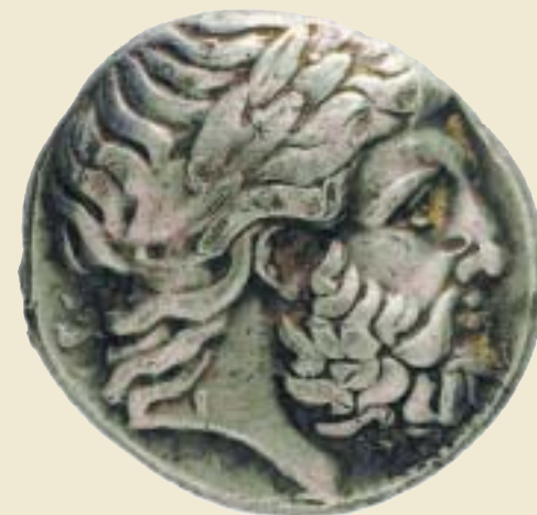
ΦΙΛΙΠΠΟΣ Β΄ (383-336 π.Χ)