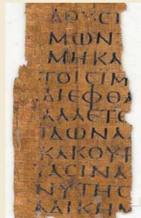
ΑΝΤΙΦΩΝ (5ος αιώνας π.Χ)

Αθηναίος σοφιστής φιλόσοφος με απόψεις για τους νόμους και τη διάρθρωση των κοινωνιών, που επιτρέπουν στους σύγχρονους αναλυτές να τον κατατάξουν στους πρόδρομους θεωρητικούς του αναρχισμού. Πράγματι μέσα από τα διασωθέντα έργα του (στη φωτογραφία μέρος αρχαίου παπύρου με αντιγραφή δικού του χειμένου) αποπνέει αποστροφή προς τους νόμους της πολιτείας και αποθέωση των νόμων της φύσης και της κοινοβιακής ζωής. Συγκεκριμένα ο Αντιφών στο έργο «Περί αληθείας» διδάσκει πως η αλήθεια βρίσκεται στην αρμονία των νόμων της φύσης που καταργούν τις εθνικές και κοινωνικές διακρίσεις και στέκονται πάνω από τους νόμους της πολιτείας, οι οποίοι δεν είναι παρά αμοιβαίες συμφωνίες ανθρώπων. Στο έργο «Περί ομονοίας» ο Αντιφών συνιστά την κοινή ζωή και τη συμφωνία ιδεών και αντιλήψεων υπό την ισότητα που υπαγορεύει η φυσική δικαιοσύνη. Δέχεται δε ως παιδεία το είδος της που επιδρά στη διαμόρφωση της προσωπικότητας και προσφέρει στον άνθρωπο τις αναγκαίες αντιστάσεις απέναντι σε αλλοτριωτικούς παράγοντες. Από το τρίτο έργο του, τον «Πολιτικό» έχουν διασωθεί μόνο σποραδικά αποσπάσματα.