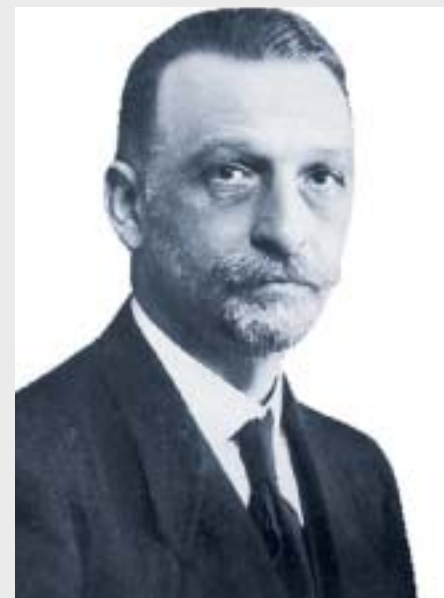
ΔΗΜΗΤΡΙΟΣ ΓΟΥΝΑΡΗΣ (1867-1922)

2. Μετακινήθηκαν πληθυσμοί το 1919 από περιοχές που αποτέλεσαν πεδίο πολεμικών συγκρούσεων.