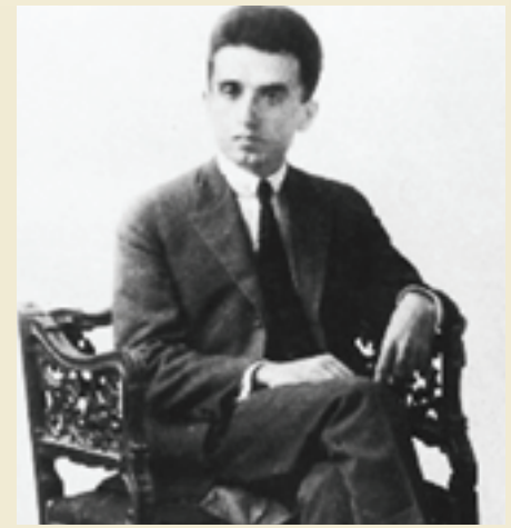
ΚΩΣΤΑΣ ΚΑΡΥΩΤΑΚΗΣ (1896-1928)