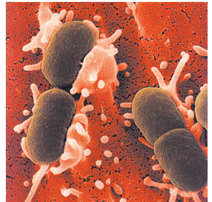
Το βακτήριο E.coli

4. Να γράψετε τα αντικωδικόνια των μορίων tRNA που συμμετέχουν στην μετάφραση του mRNA και, συμβουλευόμενοι τον γενετικό κώδικα του σχολικού σας βιβλίου, την αλληλουχία των αμινοξέων στην πολυπεπτιδική αλυσίδα τη στιγμή που ολοκληρώνεται η σύνθεσή της σε κάθε περίπτωση του προηγούμενου ερωτήματος.