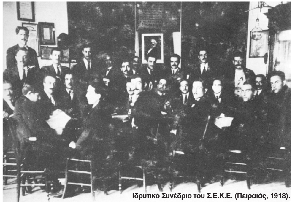
Ιδρυτικό Συνέδριο του Σ.Ε.Κ.Ε. (Πειραιάς, 1918).

Εφ. Ριζοσπάστης, αρ. φύλλου 474, Δευτέρα 12/11/1918